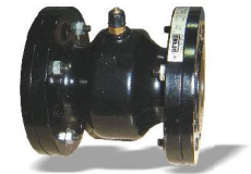
Фланцевый пережимный клапан

Тем чтобы обеспечить герметичность 100%, трубопровод давление должно быть не менее 1,5 бар ниже, чем давление воздуха.